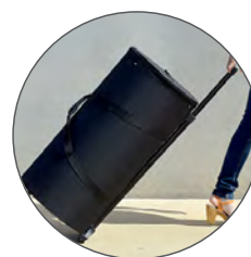
Bolsa de transporte