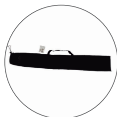
Bolsa de transporte