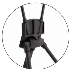
Detalle fijación varillas