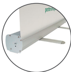
Aluminio de gran calidad

Una solución económica, llamativa y reutilizable ideal para exponer imágenes en todo tipo de espacios: ferias, puntos de promoción, recepciones, vestíbulos y centros comerciales entre otros.