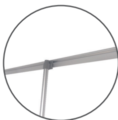
Sistema pinza de sujeción imagen