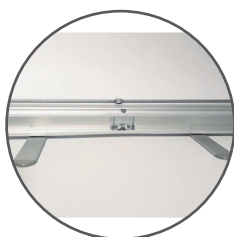
Anclaje de mástil reforzado