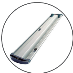
Piezas de ajuste en la base