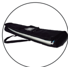
Bolsa acolchada de apertura lateral