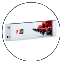
Caja de transporte