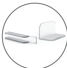
Piezas de unión de estructuras